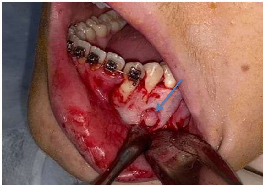
Figura 4 - Realização da osteotomia, com alta rotação.

Foi realizado a osteotomia (Figura 4) com broca esférica número 702, em alta rotação, a mesma foi realizada sob irrigação abundante com solução fisiológica a todo momento. A osteotomia consistiu em desgaste ósseo e exposição da lesão.