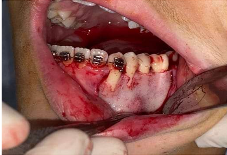
Figura 3 - Realização do retalho e descolamento mucoperiosteal.

de toda a mucosa incisionada, para a realização do descolamento foi utilizado o molt, para que assim fosse obtido acesso direto ao osso e conseqüentemente à região da lesão.