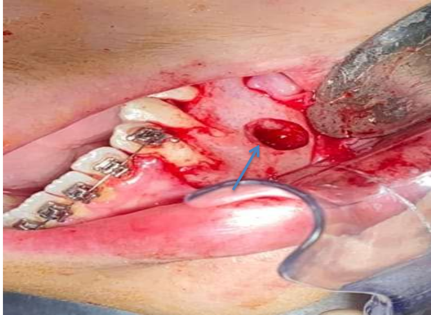
Figura 5 - Remoção da lesão.

Os próximos passos cirúrgicos foram a irrigação abundante, remoção de espículas ósseas e sutura com fio de nylon 4.0. Foram instituídos ainda as medicações e orientações pós-operatórias.