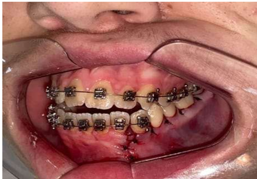
Figura 6 - Reposição do retalho e realização da sutura.

Uma semana após o procedimento cirúrgico o paciente retornou à instituição sem apresentar queixas, sem sinais de infecção e com uma boa resposta ao tratamento. Após a análise pós-operatória foi realizada a remoção da sutura, sendo solicitada radiografia para