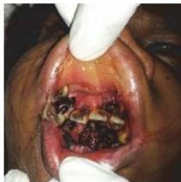
Figura 6 - Miíase cavitária na boca