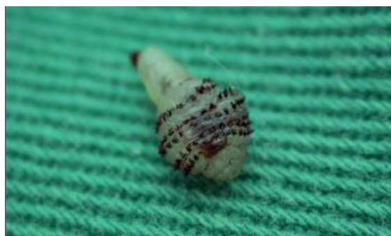
Figura 2 - Larva de Dermatobiahominis