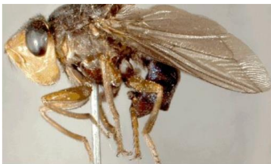
Figura1 - Mosca da espécie Dermatobiahominis .