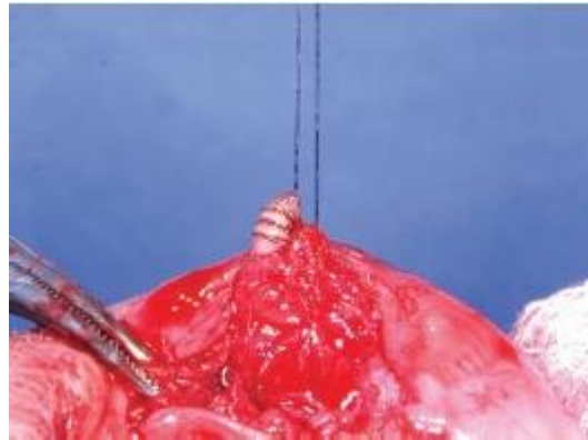
Figura 7. Larva sendo removida do lábio

foram utilizados para forçar a saída das larvas, mas os resultados foram insatisfatórios (4, 29) .