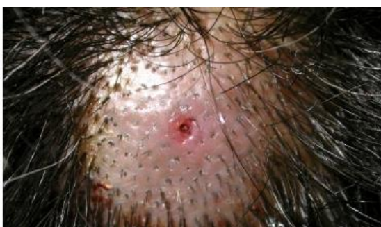
Figura 3 - Acesso da larva- Berne na cabeça