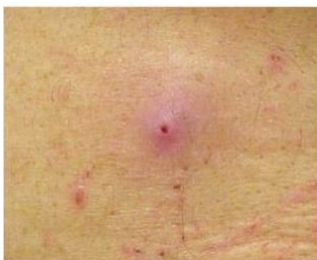
Figura 5 - Miíase cutânea na pele

cutânea, a larva produz um processo semelhante a um furúnculo, invadindo a derme e feridas pré-existentes, causando respectivamente miíase de feridas ou miíase dérmica (Figura 5). Já as miíases cavitárias são aquelas nas quais as larvas desenvolvem-se nas cavidades naturais do corpo humano como ouvidos, boca, o nariz, olhos, vagina ou o ânus (Figura 6). A ingestão acidental de larvas ou ovos de moscas provoca a miíase intestinal. Segundo Linhares (11) , essa classificação tem sido pouco utilizada, pois espécies diferentes de larvas podem parasitar um mesmo local e serem diferentes no que se refere ao comportamento biológico.