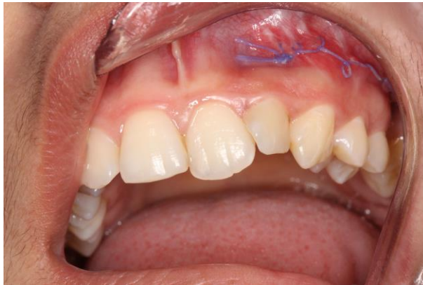
Figura 5: Ferida cirúrgica após 15 dias.