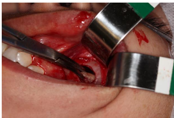
Figuras 3 – Acesso ao seio maxilar e retirada do corpo estranho.