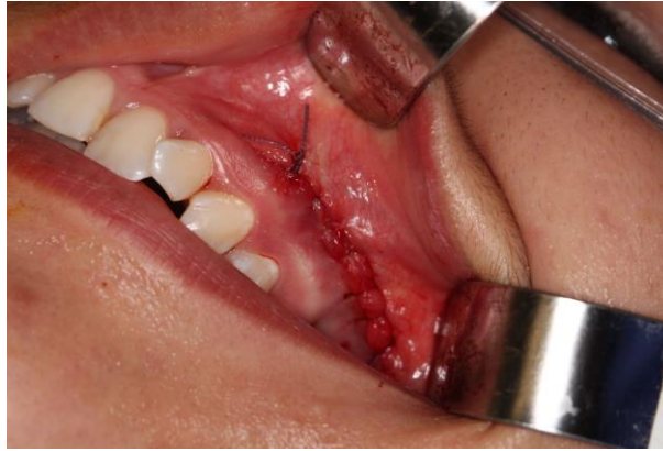
Figura 4: Sutura realizada após a remoção do corpo estranho.